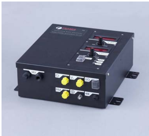
7360 (30KV) 和 7560 (50KV) 静电发生器