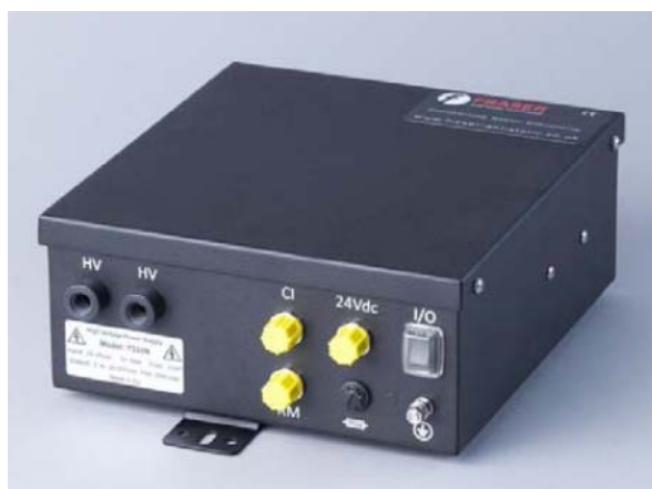
7333 (30KV) 静电发生器